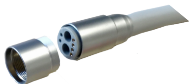
Cordon Double-fonction (4 e voie câblée) pour Micro-moteur BIEN AIR ou turbine