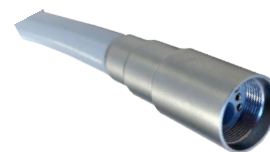
Cordon Micro-moteur NSK M40